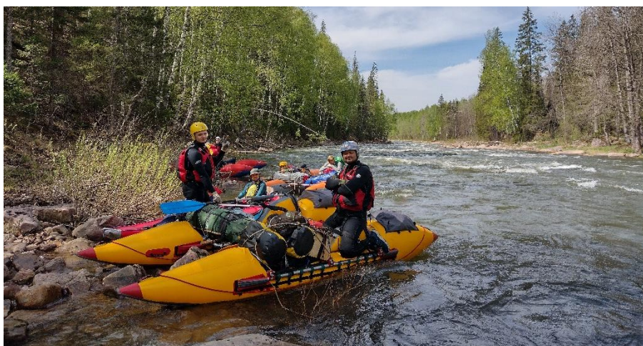
Фото 26. Промежуточная перечалка в пороге