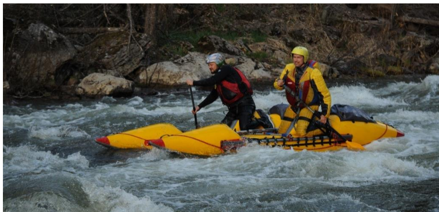
Фото 13. Экипаж К2-2 (Кузнецов Б., Фролов С.) проходит порог Черная Речка.