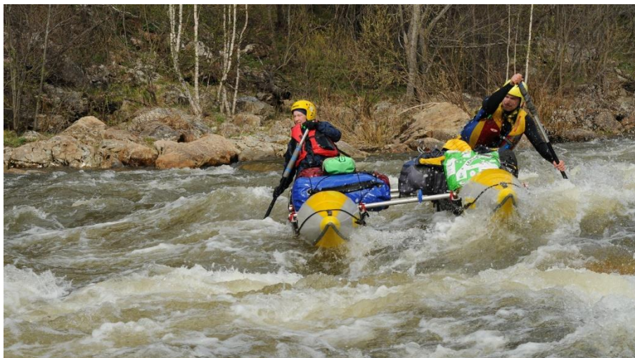
Фото 7. Экипаж K2-2 Кузнецов Б. и Кузнецова Е. проходят Айгир.