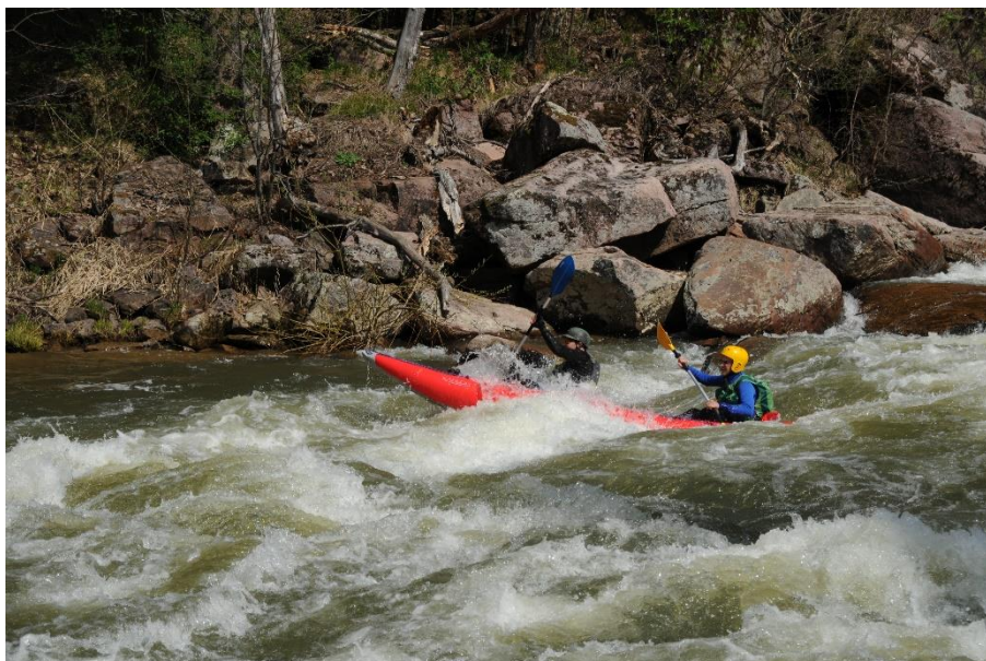
Фото 19. Экипаж байдарки (Жаринов Е. и Мерчин С.) проходит порог Черная Речка