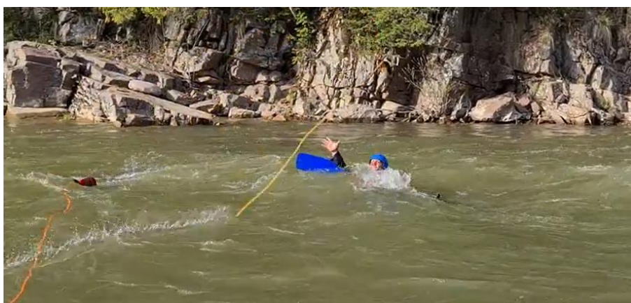
Фото 25. Тренировочные спасработы