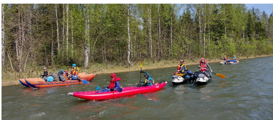
Фото 27. Походная колонна