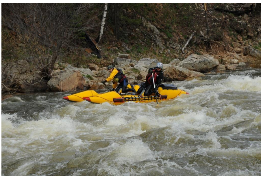
Фото 9. Составной экипаж K2-3 Фролов С. и Николаиди С. проходят Айгир.