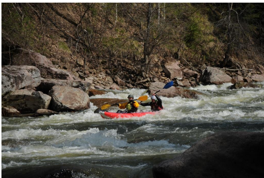
Фото 22. Экипаж байдарки (Фролов С., Николаиди С.) проходит порог Черная Речка