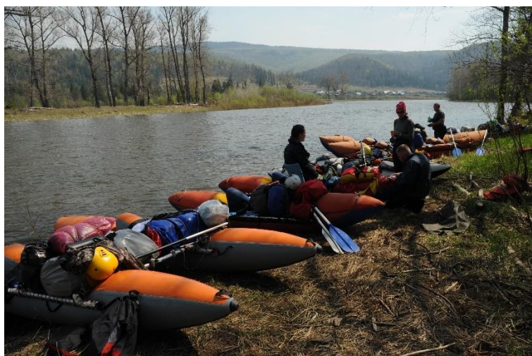
Фото 10. «Парад катамаранов» во время обеда

В 18.00 закончили погрузку вещей в первую машину (люди поехали во второй) и переехали в д. Искушта на р. Лемеза. (1,5 часа)