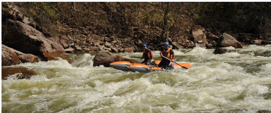
Фото 15. Экипаж К2-5 (Пуцев А. и Утицких Д.) проходит порог Черная Речка