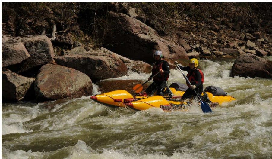
Фото 16. Экипаж К2-3 (Фролов С. и Павлов В..) проходит порог Черная Речка