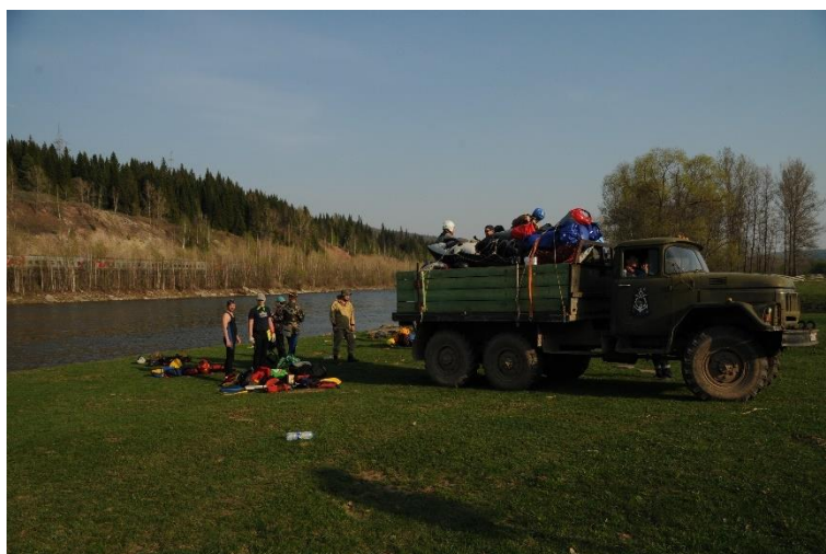
Фото 11. Вещи погружены, пора на новую реку