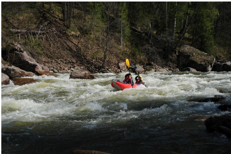
Фото 18. Экипаж байдарки (Кузнецов Б. и Кузнецова Е.) проходит порог Черная Речка