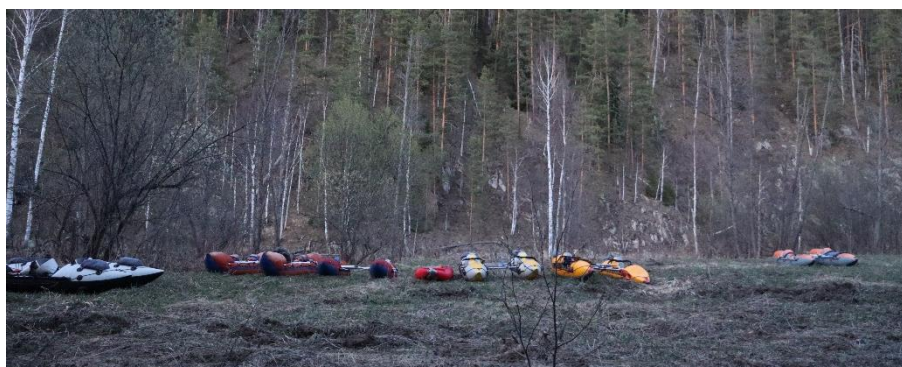
Фото 2. Катамараны на поляне.