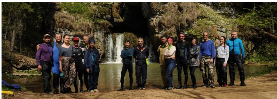
Фото 29. Группа у водопада Атыш

Проснулись поздно, долго собирались. На воду вышли в 12.40. В 12.55 были на поляне п.б. у водопада. Сходили на водопад, поднялись к пещере и на смотровую площадку. В 14.15 продолжили движение. В 17.40 были на точке Антистапеля – поляна на л.б перед мостом у д. Верхние Лемезы.