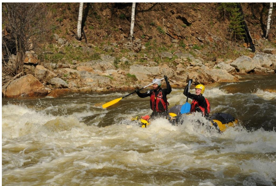
Фото 3. Экипаж К2-3 Фролов С. и Павлов В. проходят Айгир.

В 17.50 перепаковались и продолжили движение. В 18.10 пришли на место стоянки напротив большой скалы.