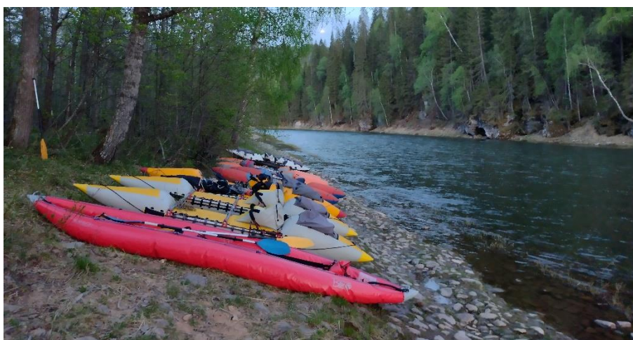
Фото 28. Катамараны на берегу