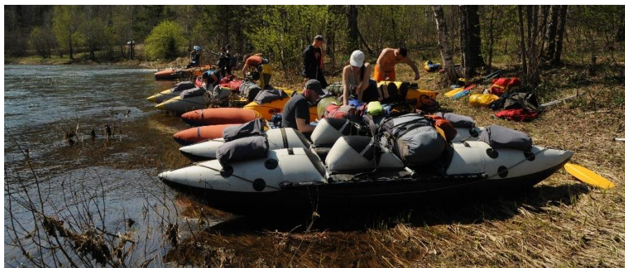
Фото 12. Стапель на Лемезе