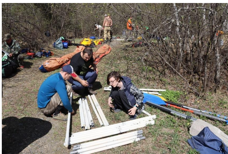
Фото 1. Стапель.

Итого стапель продолжался 4 часа, включая перерыв на обед. На воду вышли в 17.15, в 18.30 встали на ночевку на поляне Л.Б.