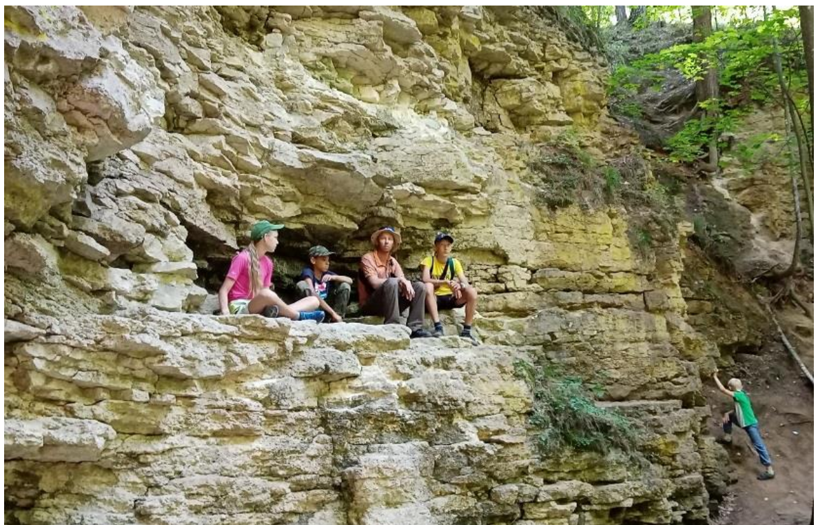
Дети были довольны.