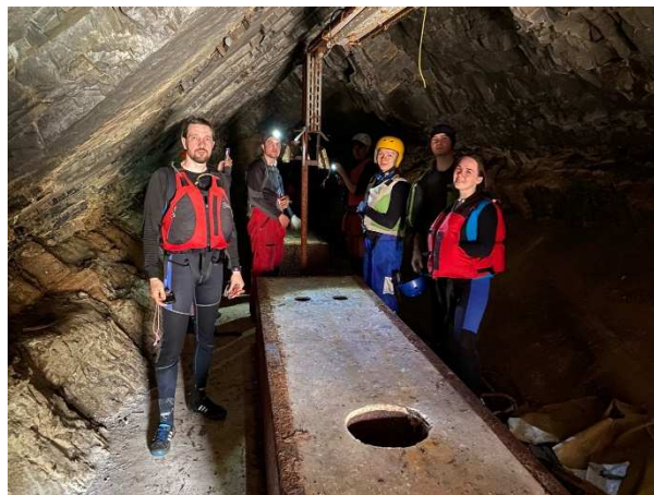
Фото 17. Остатки сейсмостанции

На обед остановились напротив одной из таких скал, расположенной на левом повороте реки. Печет солнце, очень жарко. Отлично перекусили, расположившись на галечном пляже левого берега и параллельно долго наблюдали за другой группой, которые что-то делали у ручья напротив нас, под скалой. После окончания обеда и ухода соседней группы, к ручью перечалились и мы. Пофотографировались на фоне небольшого водопада и прошли по чьей-то тропе вверх по течению, но ничего толкового не нашли. Видели дорогу на смотровую площадку на скале, но не стали туда подниматься из-за ограниченного времени.