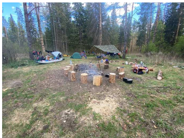
Фото 24. Шикарная стоянка