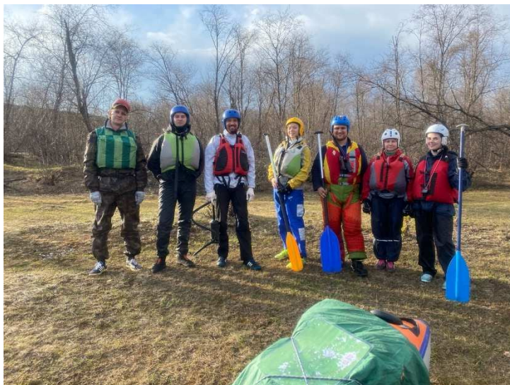
Фото 3. Перед стартом второго дня

Встали в 8.30, приготовили завтрак, увязались, отчалили. Река немного упрощается, хотя порой за счёт расчёсок образуются достаточно узкие ворота. В XX минут проходим мост, от которого ведет дорога в д. Зигаза. Идет дождь, группа немного замерзла, поэтому решаем устроить обед-перекус под небольшим навесом.