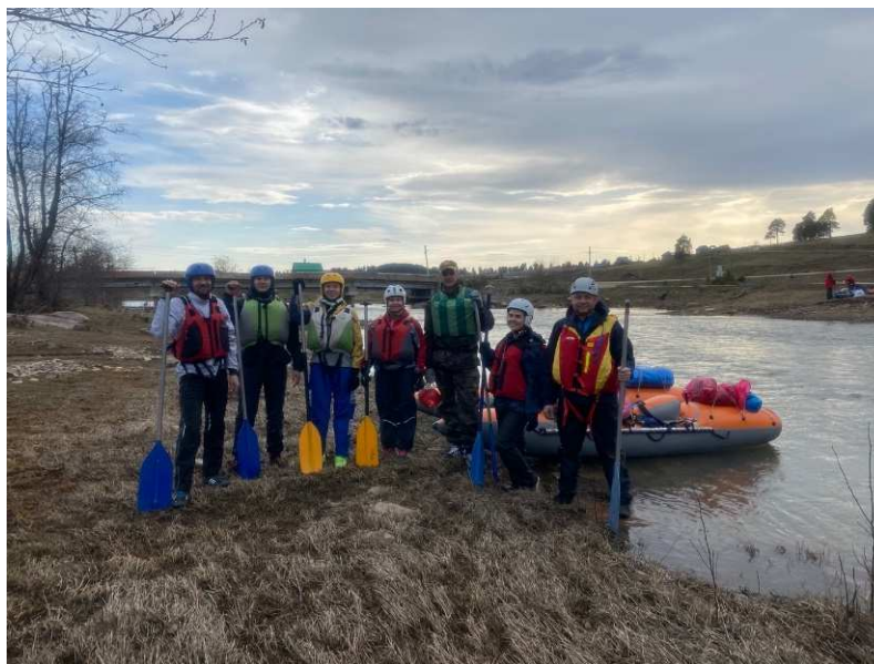
Фото 2. Перед стартом.

Итого стапель продолжался 3,5 часа, включая перерыв на обед.