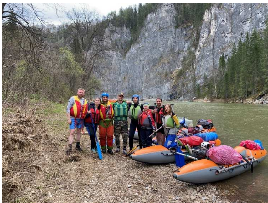
Фото 21. У Толпаровских скал

Через 6 км после Толпаровских скал пообедали. Налетели тучи, начал накрапывать дождик. Так под дождем дошли до Толпарово и ушли в нижнюю часть реки. Из-за непрекращающегося дождя и ветра стали подмерзать участники, стали чаще останавливаться на разминки и согрев. Берега не очень удобные для стоянок. Покося или скалы, много высокой травы, местами топко и много кустов. В итоге встали на излучине прямо перед длинным прямым участком, так как следующие 5 км стоянок не должно было быть (и не было) Дождь прекратился. Долго ходили за дровами и ставили лагерь, так как на стоянке много кочек и ровных мест под палатку не так много. Поужинали и практически без гитары пошли отдыхать.