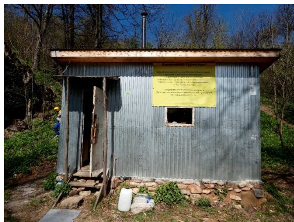
Фото 25. Домик спелеологов