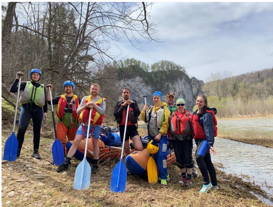
Фото 19. Приехали на реку

Осмотрев пару полян, которые не сильно нам приглянулись, дошли до противоположной стороны излучины и там увидели прекрасное место. Кто-то до этого сильно намусорил там, но ели, пихты и шикарный вид на реку всё это компенсировали. Потратив около 40 минут на уборку и приведение в порядок лагеря, поставили палатки и принялись готовить ужин. После дали возможность девочкам помыть головы. Вечером, несмотря на длинный переход, усталости как не бывало, прекрасное настроение, жаркий костёр и, конечно, песни под гитару и без неё. Разошлись по палаткам во 2 часу.