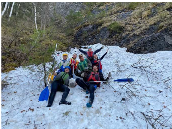
Фото 16. Соскучились по снегу