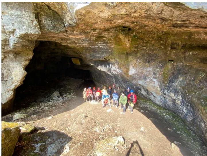
Фото 24. Пещера Киндерлинская

По возвращении перечалились на левый берег подальше от толпы народа и там приготовили обед. Пока дежурные готовили, успели с Димой Трифоновым сбежать ко второй большой пещере Римовской (сквозной) на левом берегу. Осмотрев вход, вернулись, покушали и встали на воду. Через 6 км на левом берегу открылась огромная поляна у моста через Зилим, там уже стояли автобусы разных размеров и вели антистапель разные группы. Найдя незанятый клочок суши, вытащили вещи, отмыли и разобрали суда, выложив их на просушку. Застали массовый перелет майских жуков на закате, оперативно свернулись, погрузили всё в машину и прицеп и выехали в Ульяновск.