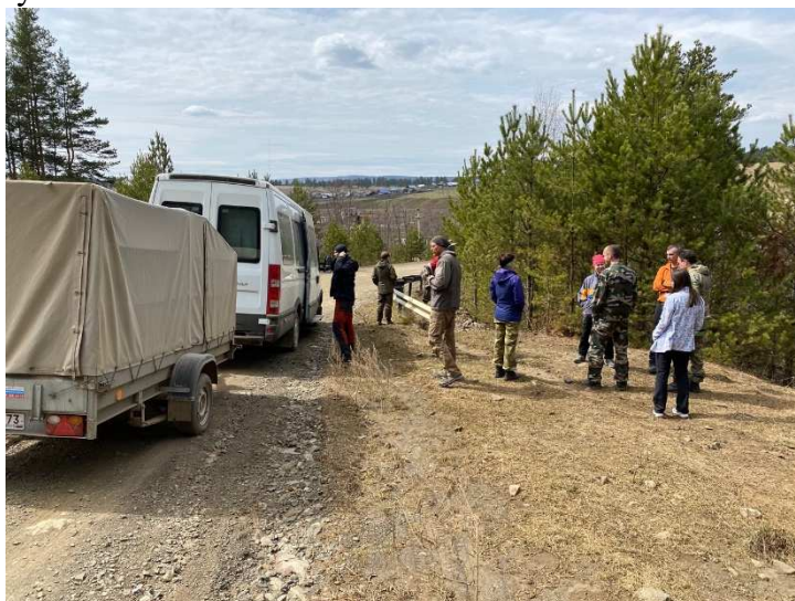
Фото 1. Приехали на реку

Машина начала собирать участников с 22.00, но из-за большого кол-ва груза и необходимости его увязки в прицепе выехали из города около 23-30. Дорога местами разбитая, местами хорошая. На последних 50 км, после поворота к пос. Тукан и Зигаза асфальт переходит в гравий, скорость движения падает. Приехали на место в 12-40. Итого время в пути (с учетом погрузки и крепления груза) 14 часов 40 минут.