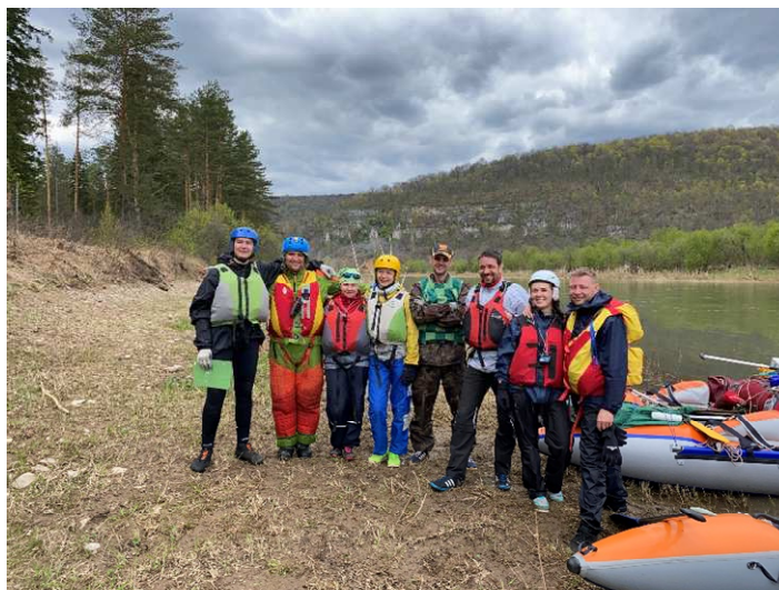
Фото 23. Вот тут и заночуем

За 10 км до пещеры увидели шикарную стоянку с баней на левом берегу. Из-за сильного встречного ветра и опасения занятости стоянок внизу реки, сразу сообща решили делать полудневку, дожидаться вторую группу и затопить печку. Потратив около часа на перекладывание печки, наконец-то затопили её и стали готовить обед. Вскоре подошла вторая группа байдарочников и мы уже встали вместе.