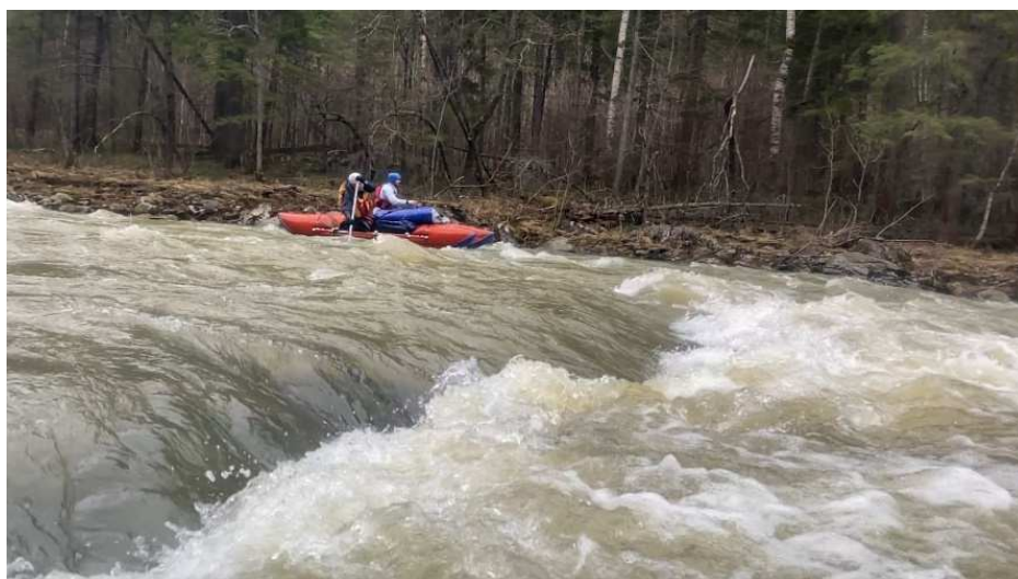
Фото 9. Витя и Сергей