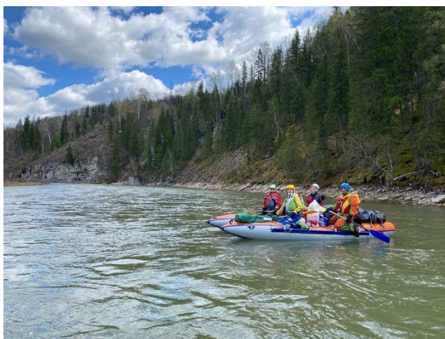
Фото 22. Трое в лодке не считая капитана

Идти тяжело из-за сильнейшего встречного ветра. Так же сказывается напряженный график маршрута и ожидание полудневки. Темп гребли упал, пришлось немного перетасовать экипажи. В итоге наивысшего темпа достигли, когда сформировали 2 мужские двойки, а руководитель на 4-ке с тремя девушками.