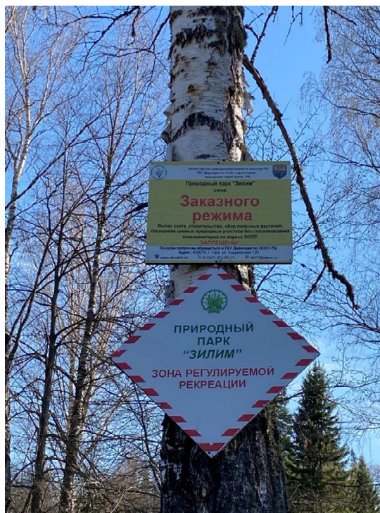
Фото 18. Теперь тут нацпарк

Прошли не останавливаясь мимо домиков вновь образованного национального парка. Отдельно остановились у г. Кузьегнак перед началом большой излучины омега-образной формы, которая находится перед последним поворотом к Толпаровским скалам. Солнце клонилось к закату, а мимо нас проходило великое множество групп, поэтому решили искать ночевку не доходя 3-4 км до скал, так как возле них с высокой вероятностью (потом так и оказалось) все места заняты.