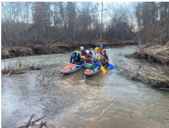
Фото 4. Зигаза – название говорящее

Встали в 8.30, приготовили завтрак, увязались, отчалили. Река немного упрощается, хотя порой за счёт расчёсок образуются достаточно узкие ворота. В XX минут проходим мост, от которого ведет дорога в д. Зигаза. Идет дождь, группа немного замерзла, поэтому решаем устроить обед-перекус под небольшим навесом.