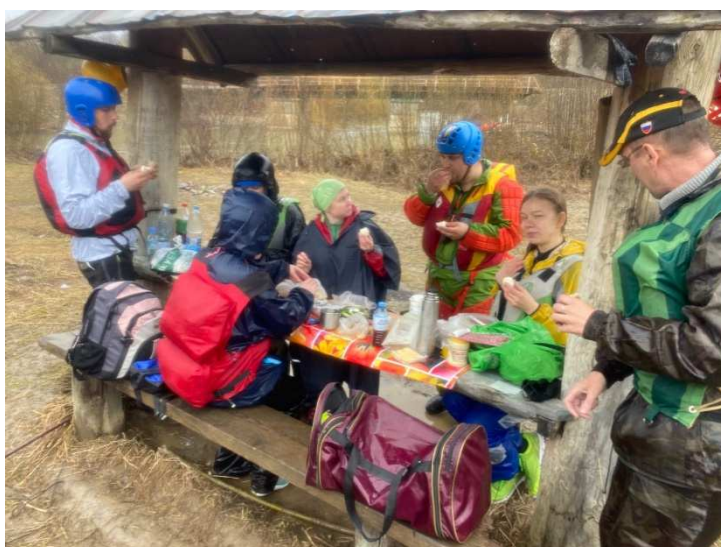
Фото 5. Обед под навесом