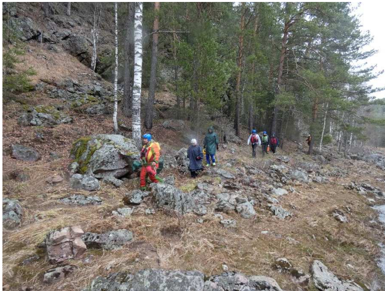
Фото 6. Осмотр порога Кысык

Начинают себя проявлять желудочные расстройства, которые потом будут ещё дня два мучать по очереди участников группы. После обеда остается не так много до пор. Кысык. Через XX км обгоняем наших байдарочников, расположившихся на обед и останавливаемся сами, чтоб дождаться К-2, который немного отстал. Продолжаем движение всей группой, отрабатываем навыки управления катамараном перед прохождением порога. Нас обгоняет наша вторая группа и уходит вперед, но вскоре за поворотом появляется место чалки и начало тропы просмотра пор. Кысык.