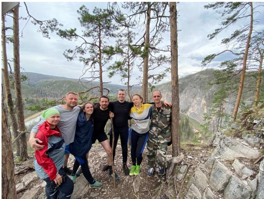
Фото 20. Смотровая площадка