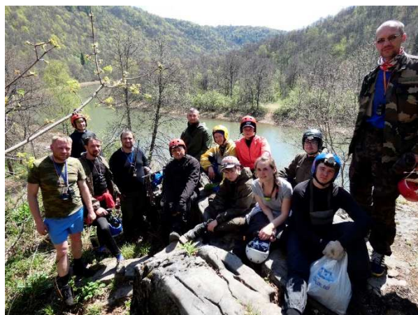
Фото 24. Над поляной у пещеры

Утром после бани собраться было сложно, но форсировав этот процесс вышли на воду. Сделав передышку у грота на левом берегу, пошли дальше к поляне у пещеры. Там уже было множество групп, а так же домик спелеологов-инструкторов, которые водят экскурсии в пещеру. Отметившись в журнале ТБ, вышли в сторону пещеры объединенной группой. Прошли пещеру, местами организовывая перильную страховку, до лаза «Пылесос». Дальше идти не планировали, так как имели ограниченное время.