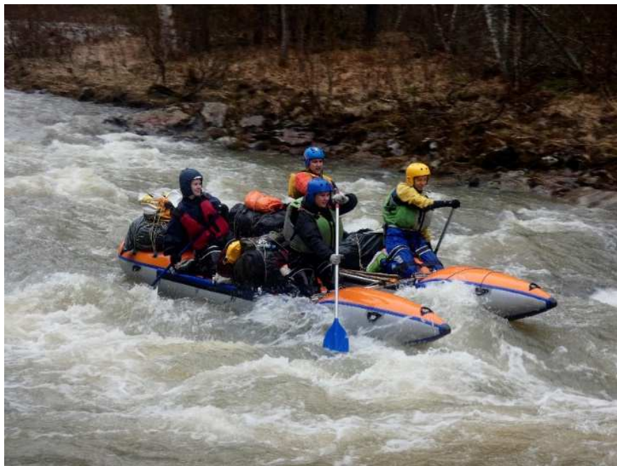
Фото 7. К4 в пороге Кысык

Тропа просмотра/обноса узкая, для заноса катамаранов неудобная. Есть узкие проходы между деревьям, при обносе судно часто придётся «кантовать».